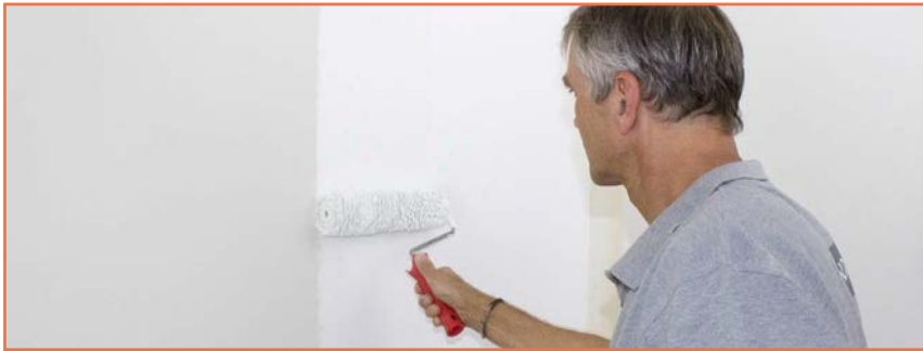
// Vorbereitung der Untergründe mit der Putzgrundierung.

Die Putzgrundierungen sind gebrauchsfertig auf der Basis Kali-Wasserglas, die bei Bedarf noch weiter mit Wasser verdünnt werden können (Richtwert: + ca. 10 %). Der Auftrag erfolgt meist mit der Rolle. Das Korn des Lehmstreich- und -rollputz kann an diesem körnigen Untergrund besser hängen bleiben, so dass die Kornverteilung homogen ist. Außerdem schaffen die Grundierungen einen einheitlich weißen Untergrund, damit die nachfolgenden Anstriche ihre volle Farbkraft entfalten können.